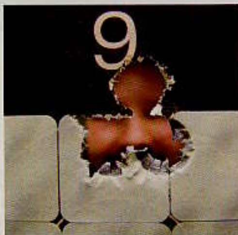
Så här tätt slår 9,3:an när det går som bäst på 100 meters avstånd.

Proceduren kan verka tidsödande men ger bevisligen effekt i form av täta träffbilder. Till att börja med skjuter han fem skott och efter varje skott drar han loppet noga med solvent och bronsborste. Därefter dras loppet rent.